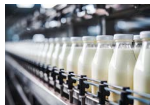
Lebensmittel- und Getränkeindustrie