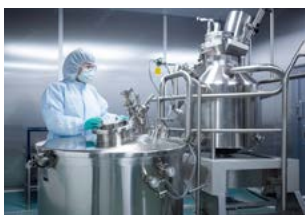
Chemie und Petrochemie